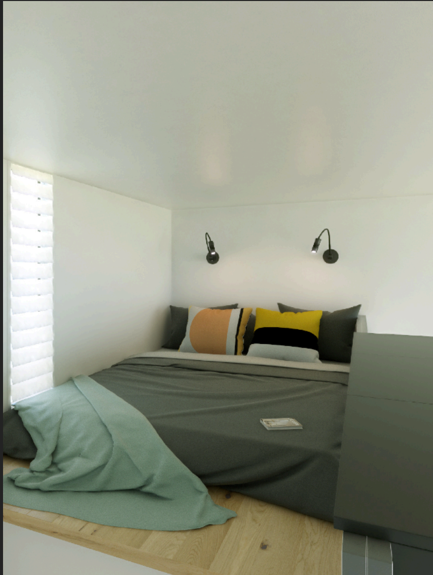
Sovloft med ståhöjd intill säng