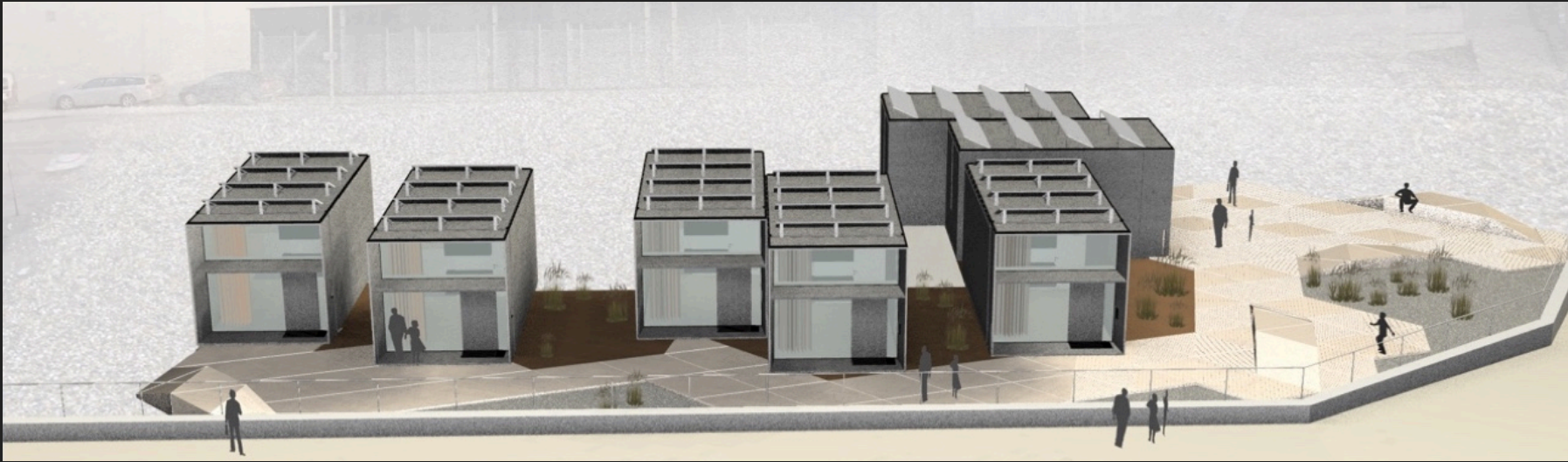
Exempel på uppställning