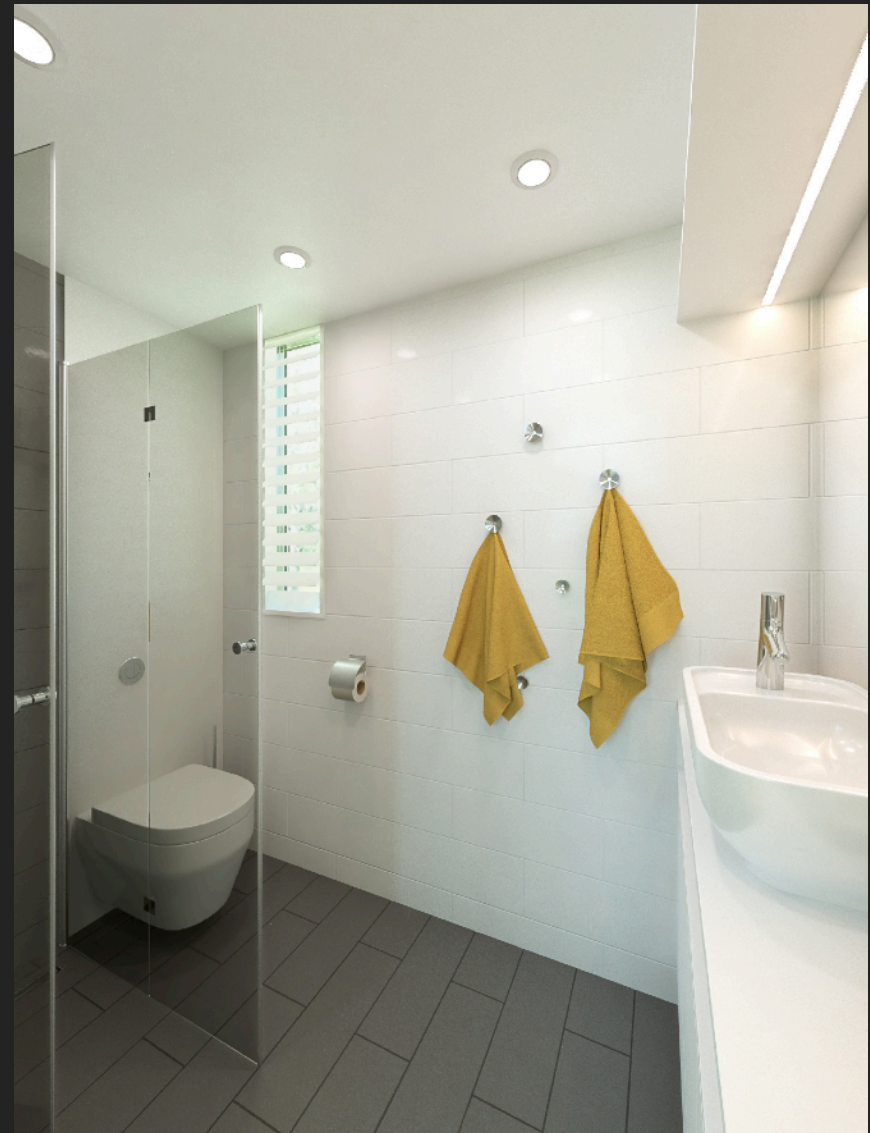
Funktionellt badrum med gömd teknik