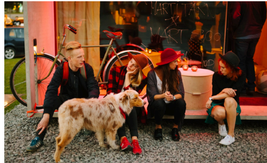
En social plats

Eftersom huset kan monteras och demonteras hur många gånger som helst, men självklart så är huset bra nog för att användas till ett permanent syfte. Huset håller mycket hög uppfinningsrikedom och kvalitet.